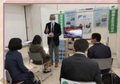
11/16 「ひょうご障害者ワークフォーラム」に出展