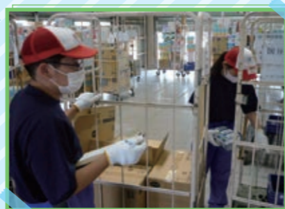
6/8 ~ 6/10