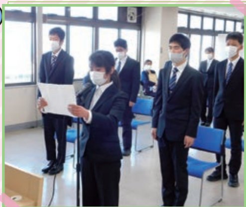
4/7 入所式 15人の訓練生で1年間の訓練がスタート