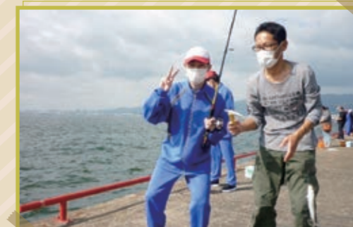
11/5 鳴尾浜海釣り公園で訓練生15人と保護者8人が参加して海釣り大会実施