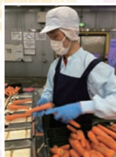
重度障がい者多数雇用事業所では(株)協同食品センターの農産加工場への派遣を開始

新しい障がい者社員も迎え、チームを越えて連携しながら毎日の業務に取り組んでいます。 また、社員の学習にも力を入れています。 3/31 現在、障がい者社員：22人（31カウント） (身体7人、知的12人、精神3人)