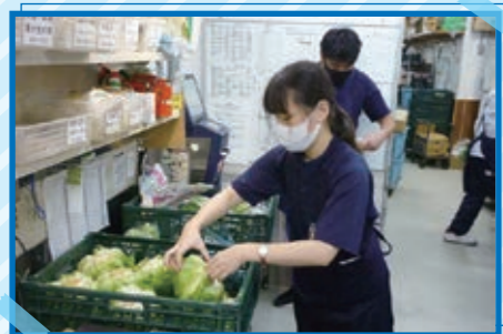
6/21 ~ 7/9 コープこうべ店舗での実習