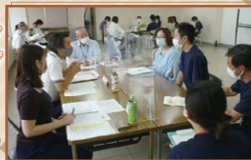
10/15 第2回就職相談会で就職に向けた動きを本格的に開始