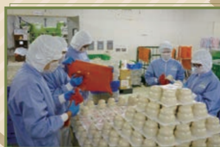
11/8 ~ 11/26 (株)コーペーカリーにて、年末用の包装お鏡の商品作りを実習