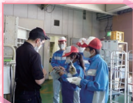
5/10 ~ 5/27 鳴尾浜配送センターでの店舗物流の実習