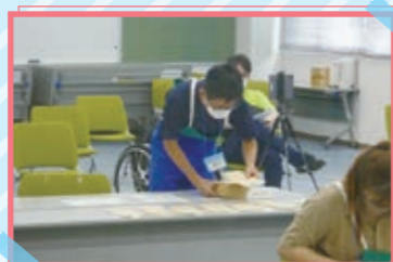
「アビリンピック兵庫2021」 (全国障害者技能競技大会)